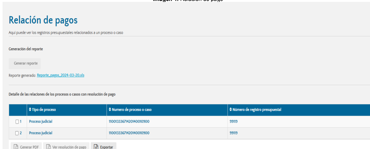
Imagen 4: Relación de pago

En la siguiente tabla se plasma el único pago que aparece en e-KOGUI, mismo que se encontró en el periodo evaluado inmediatamente anterior: